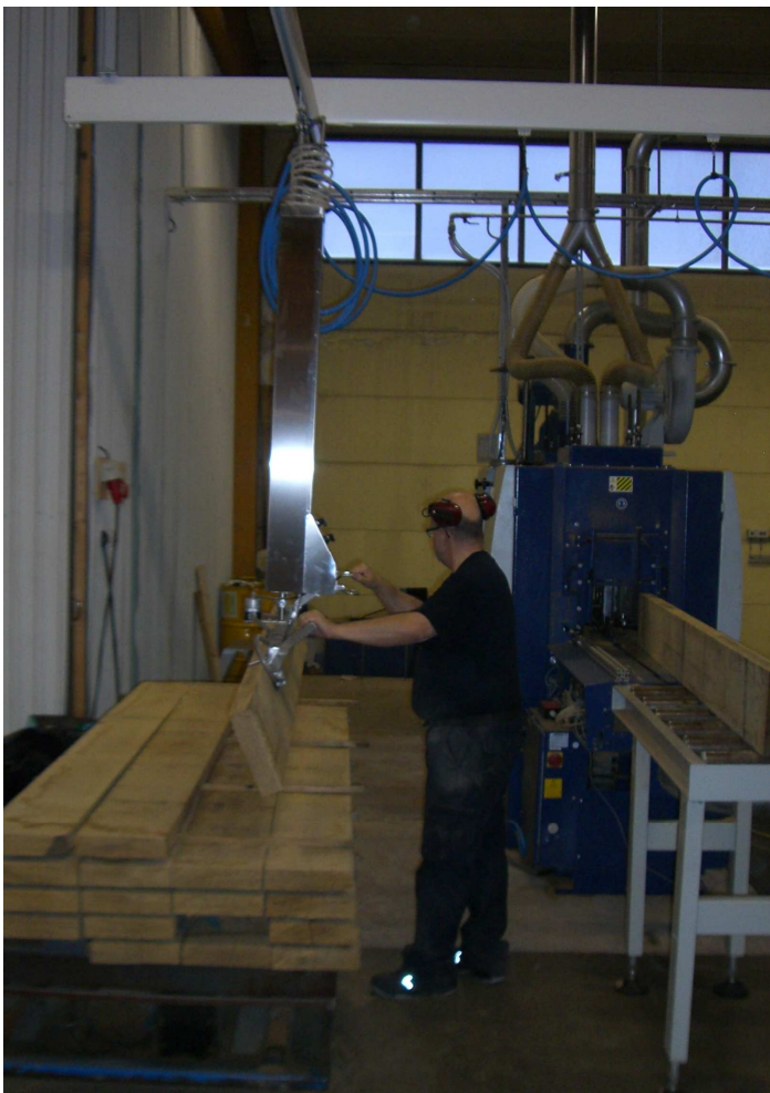
Hantering av långa & tunga träplank med ett vakuumpripdon med vinkelled.

Här ett specialanpassat vakuumpripdon med styrning, för att passa på speciella kartonger.