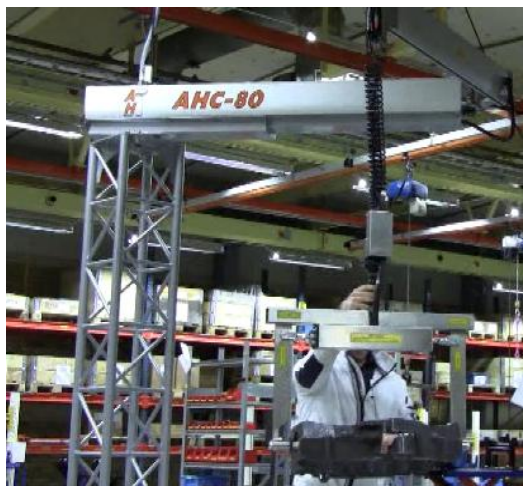
Pneumatiskt Klämaggregat med manuell vändning av maskindetalj

I manöverhandtagets övre del sitter ett membran till vilken en liten luftslang är ansluten. På lyften är slangen ansluten till en sensor och styrelektronik som känner av minsta ändring i lufttryck från handtaget. Via elektroniken styrs drivluften till lyften och ger en proportionell lyftrörelse i förhållande till handens rörelse. Handtaget och styrelektroniken som är patenterad, utgör ett unikt enkelt och driftsäkert manöverdon för lyften. Man kan alltså köra lyften steglöst, snabbt vid förflyttning och sakta men precision när det önskas. Allt med en lätt följsam rörelse av handen. Då manöverhandtaget inte används är godset i lyften utbalanserat och kan enkelt föras upp och ner. Manöverhandtaget har enkel anslutning för olika gripdon. Inbyggda säkerhetsfunktioner som förhindrar att hanterat gods kan lossas felaktigt.