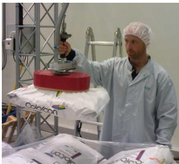
Hantering av säckar