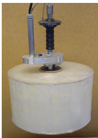
AHR-40 placerat i ett skensystem.